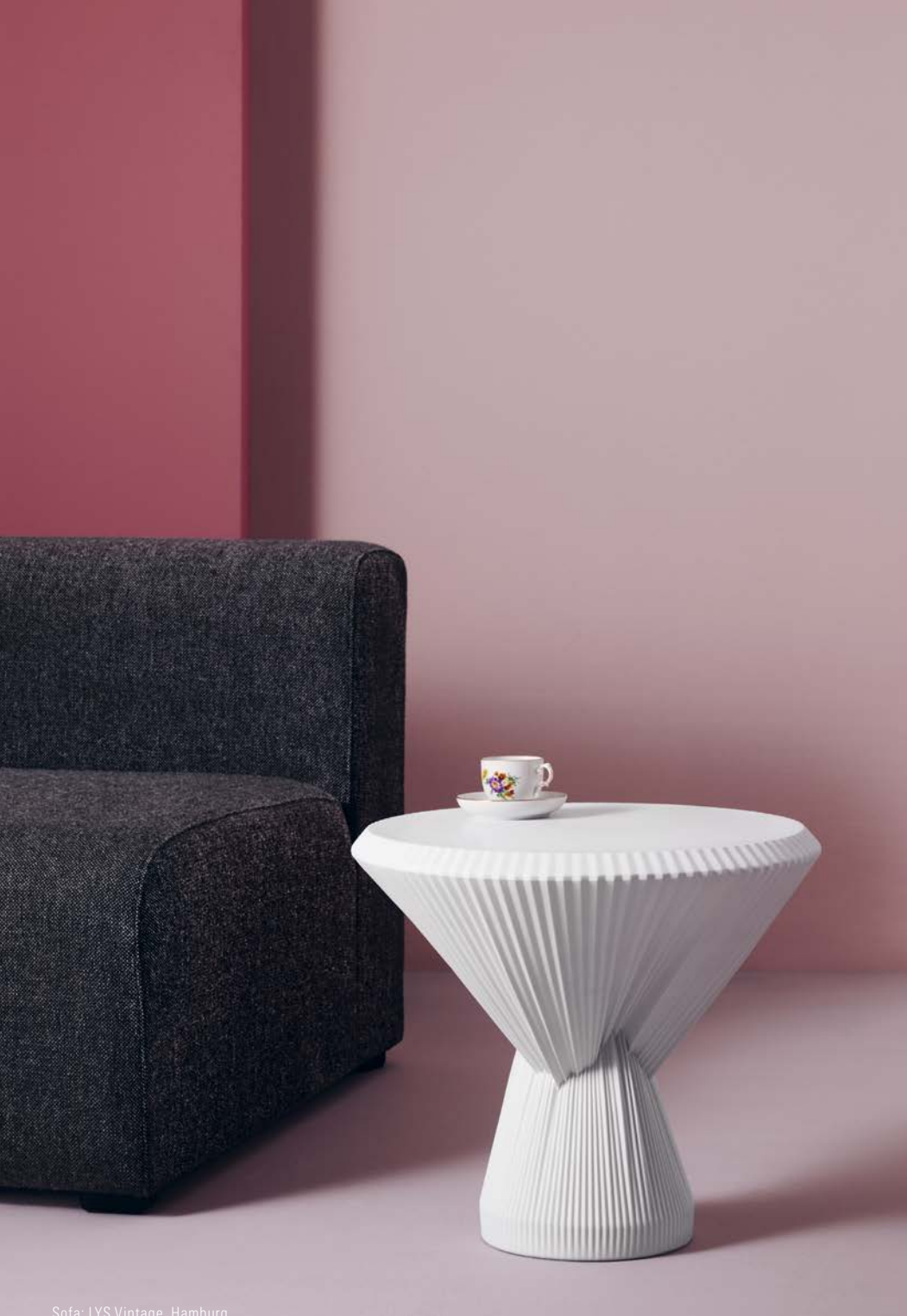
Sofa: LYS Vintage, Hamburg

Der Zufall hat eine eigene Ästhetik, finden Eva Marguerre und Marcel Besau. Das interdisziplinäre Designduo liebt das Experiment – mit Materialien und Farben, aber auch mit Algorithmen. In ihren Gestaltungskonzepten setzen Besau-Marguerre oftmals auf computergestützte Prozesse und lassen so den Zufall mitgestalten.